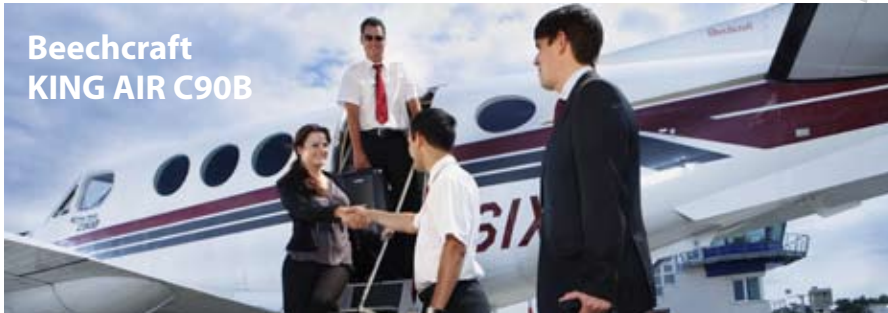
Beechcraft KING AIR C90B

Ab sofort steht unseren Kunden ein weiteres Flugzeug zur Verfügung. Bei dem Flugzeugtyp handelt es sich um eine KING AIR C90B der Firma Beechcraft.